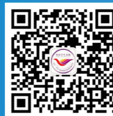
“中国学生资助” 微信公众号

本简介内容及相关文件可登录全国学生资助管理中心网站( http://www.xszz.cee.edu.cn )和“中国学生资助”微信公众号查阅