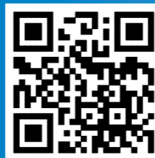
全国学生资助 管理中心网站